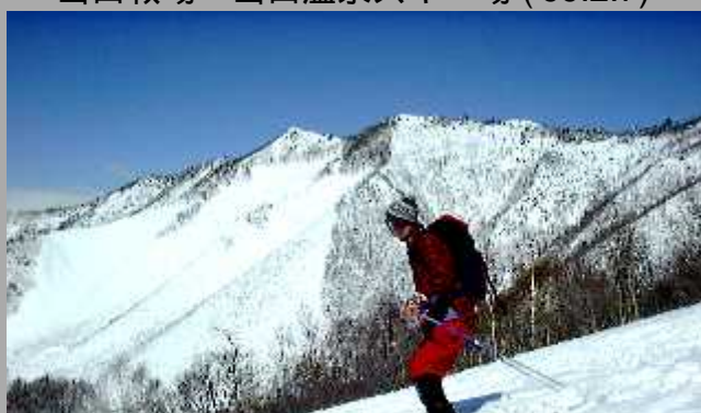
山田牧場～山田温泉スキー場 ('99.2.7)

ピラタス横岳ロープウェイ 山頂駅～出逢ノ辻～おとぎり平～大石峠～麦草峠～白駒池～麦草峠～R299～メルヘン広場～ピラタス横岳ロープウェイ山麓駅