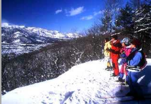
白馬クロスカントリーコース ('99.1.30) 白馬みねかたスキー場 展望歩くスキーコース

長野，神奈川，岐阜，愛知から集まった面々はまず、かの長野オリンピックで熱い戦いが繰り広げられたクロスカントリー競技場「スノーハープ」へ。整備されたコースは快調によく滑る。晴天の中、全然熱くない走り（歩き）を見せて全員完走。途中、府中市のMLからコーヒーなどの善処も。まだまだ歩き足りない面々は、続いてみねかたスキー場の歩くスキーコースへ。リフトよりダイブして新品ポールの曲げ試験と尾てい骨の圧縮強度を試験するなど、参加者の熱意は素晴らしい。晴天に恵まれ、白馬連山の展望を横目に変化に富んだコースを満喫した。