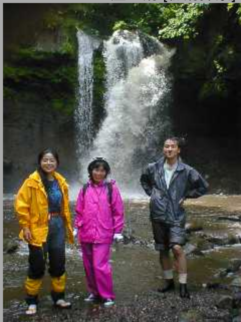
土屋の湯 [秘湯探索] ('99.7/11)