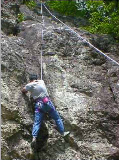
物見岩 [岩登り] ('99.7/4)

雨を心配したが、三度目の正直（2回延期した）で曇りながらもまずまずの天気。午前中は易しい ルートで練習。久しぶりの岩にみんな緊張気味。午後は（一般には易しいが参加者にとっては）難 しいルートに挑戦！充実した一日でした。岩登りは何も特別なことでは無く、山に登る時の三点支 持の練習にもなります。道具はレンタルできますから、皆さんもやってみませんか。